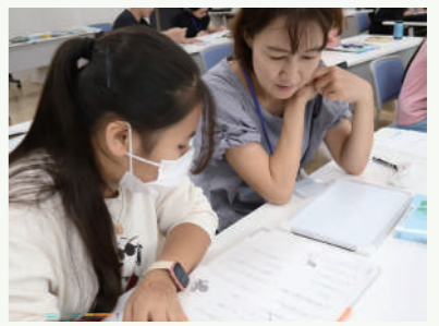
夏休み学習教室での様子