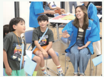
多文化ファミリー交流会での様子