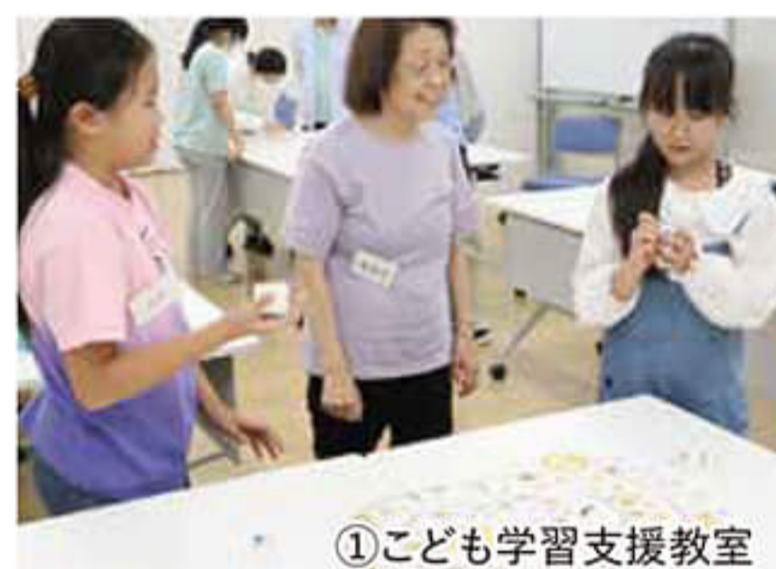
①子ども学習支援教室