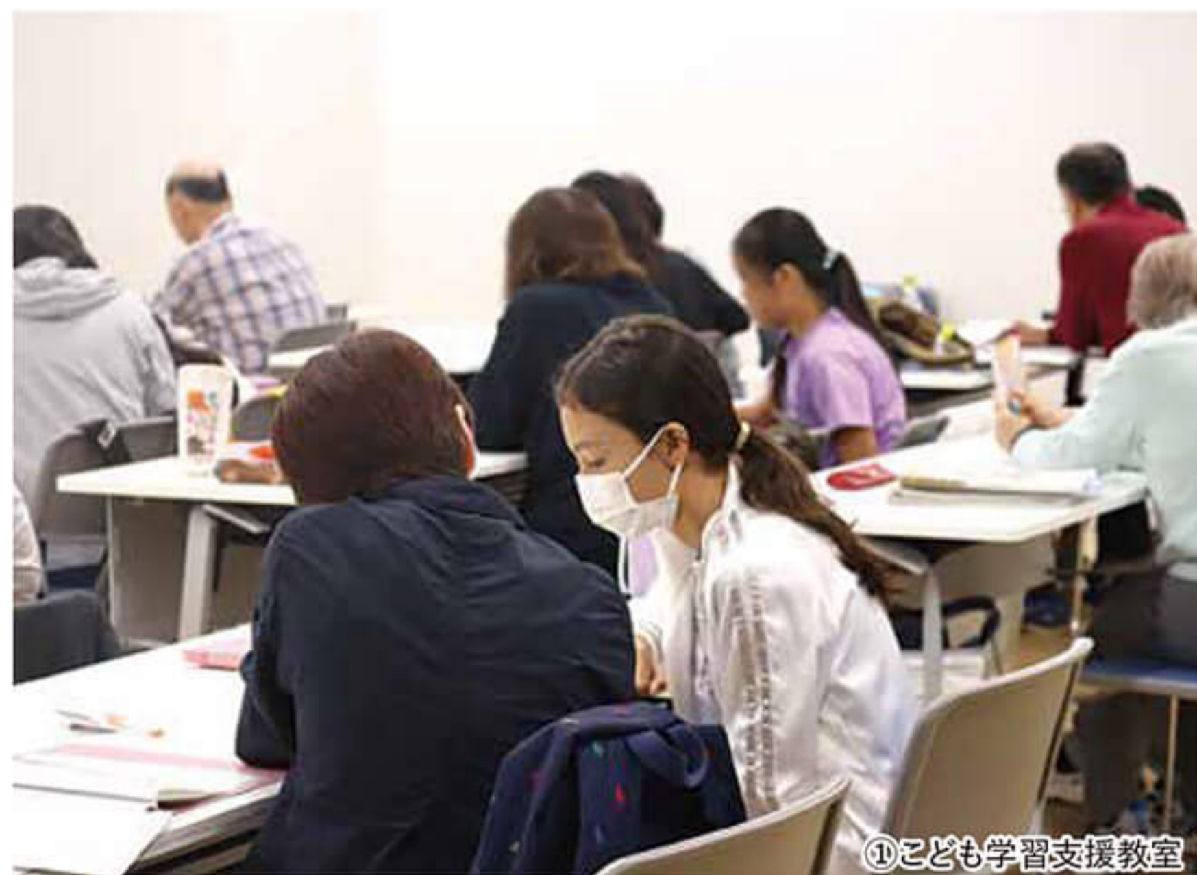
①子ども学習支援教室

日本語教室と聞くと、どんなイメージを持ちますか。教科書を使って日本語を勉強する学校のようなところ？それとも学習塾のようなところ？GOCAでは子どもや大人向けに様々な教室を開講しており、多様な国籍、幅広い年代の方が日本語を学んでいます。