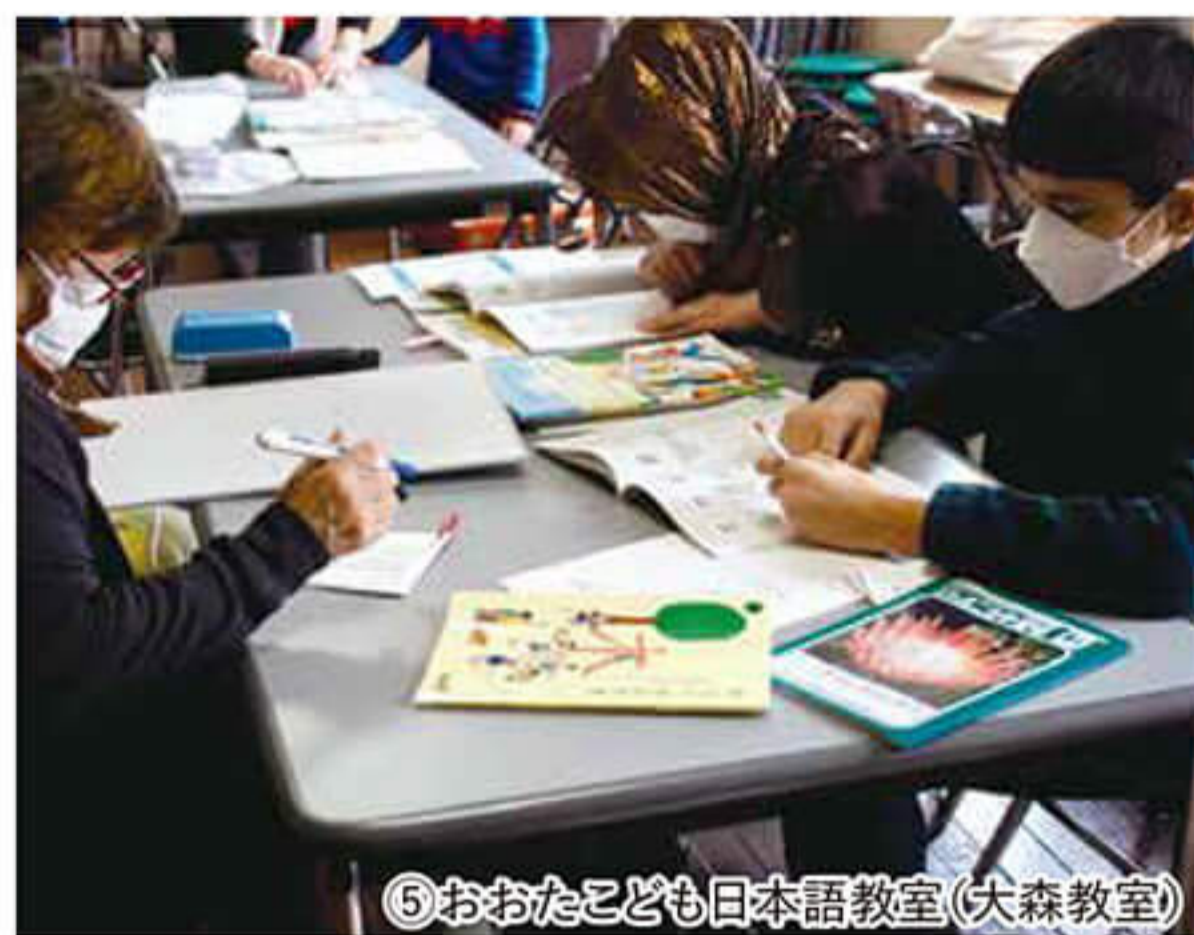
⑤おおたこども日本語教室(大森教室)