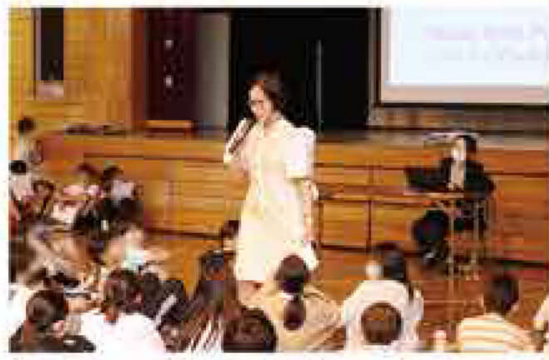
10月14日 国際理解講座(池上小学校)