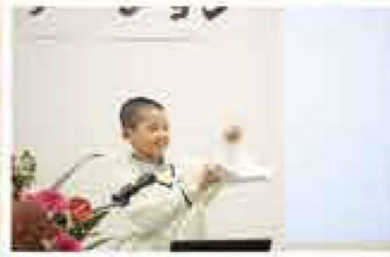
10月29日 日本語でプレゼンテーション