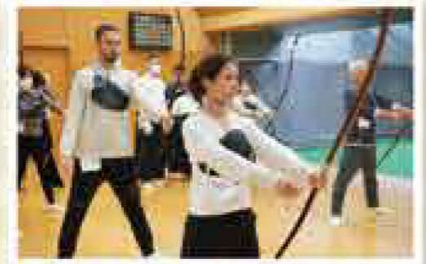
11月12日 日本の伝統文化体験(弓道)