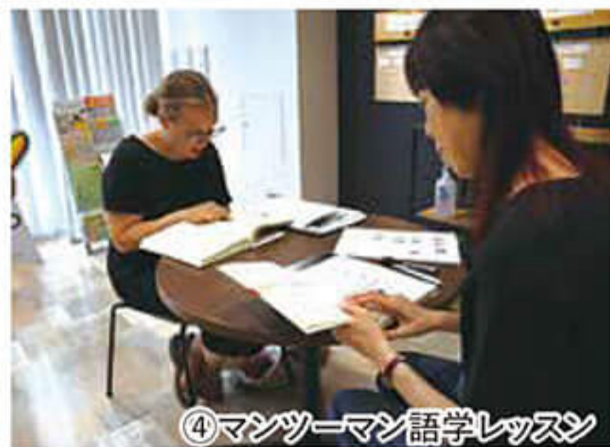
④マンツーマン語学レッスン