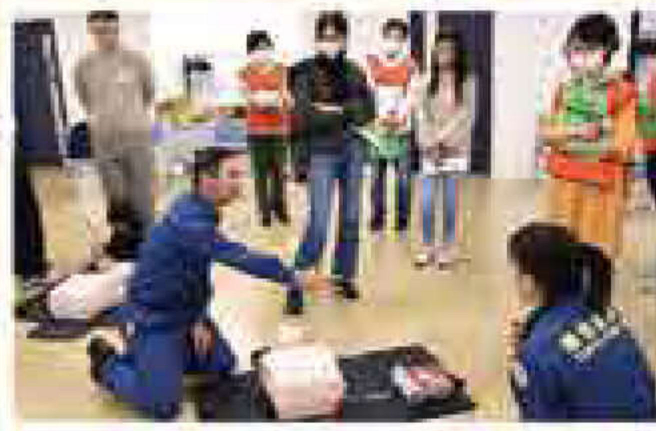
10月21日 応急救護訓練