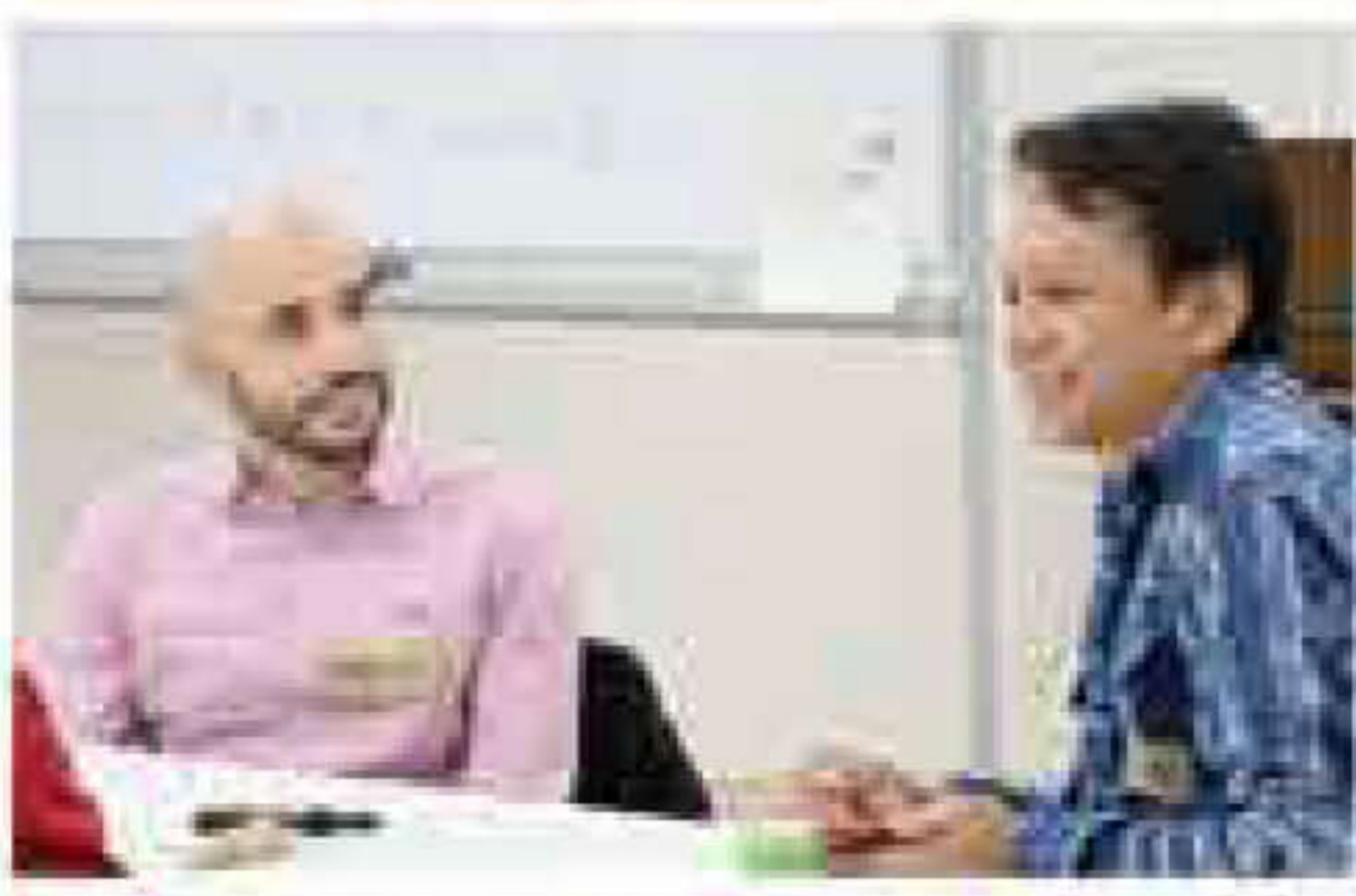
10月15日 GOCA カフェ第6回