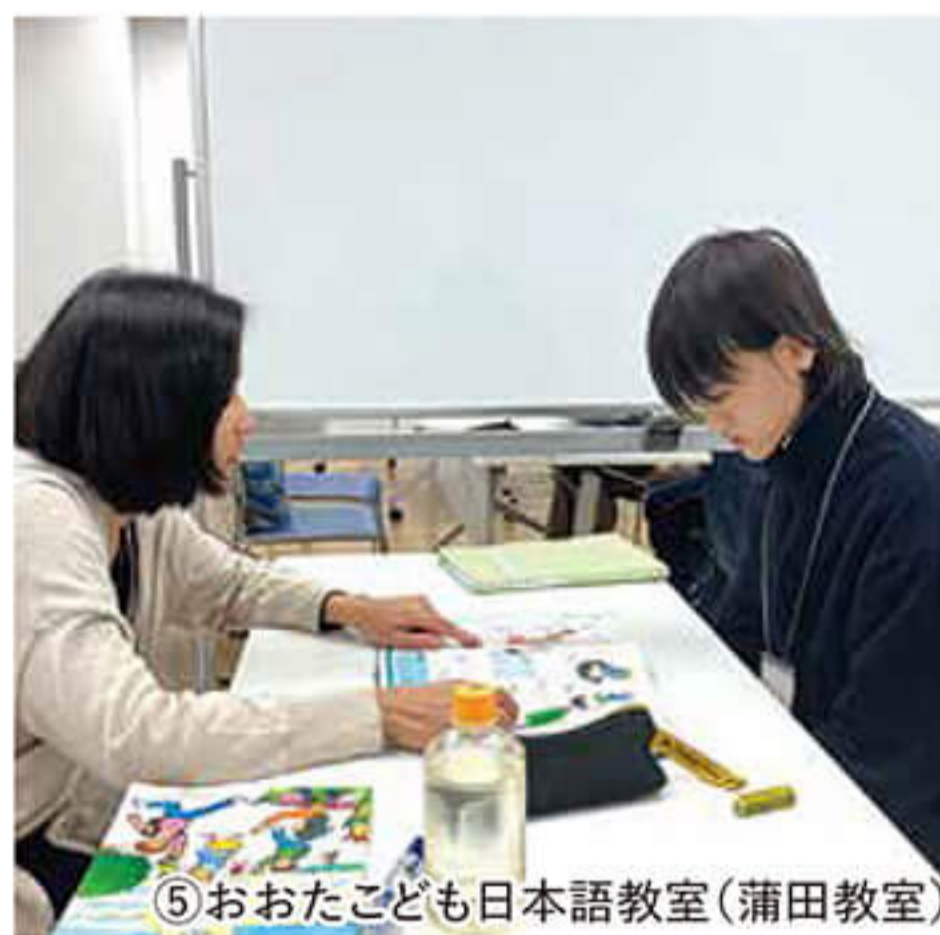
⑤おおたこども日本語教室(蒲田教室)