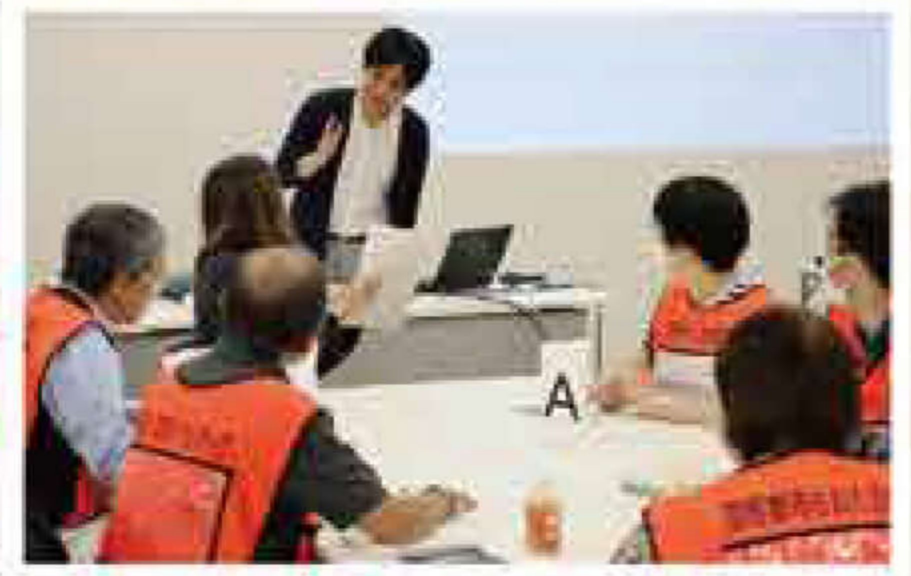
10月15日 災害時通訳訓練