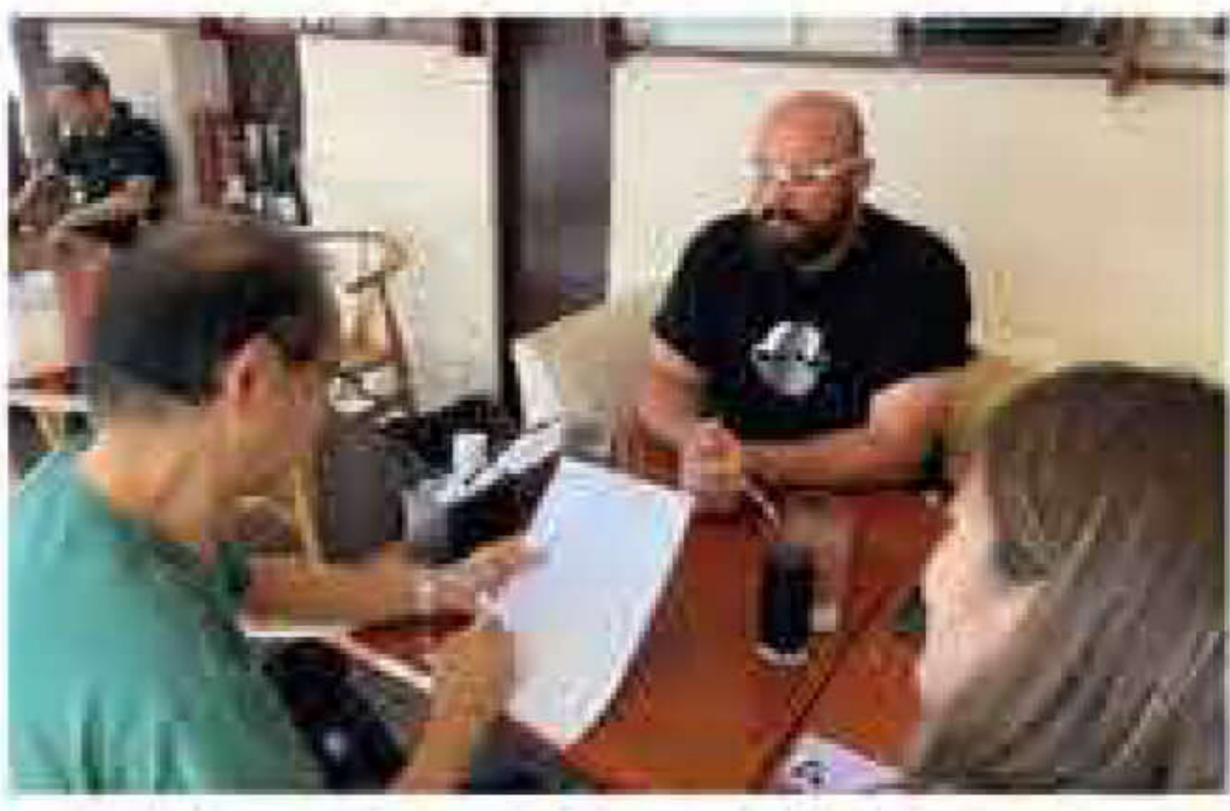
9月14日 「隣の外国人」インタビュー