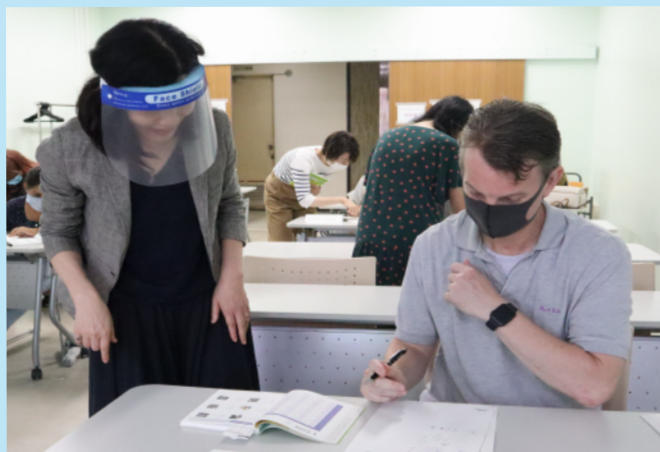
教室での授業の様子

新型コロナウイルス感染症が未だ猛威を振るう中、日本語がゼロレベルの外国人を対象に、7月から8月の2カ月間(全8回)にわたって実施してきた「初級日本語講座」が終了しました。