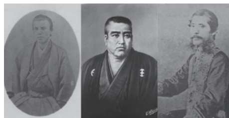
Katsura Kogoro (Kido Takayoshi), Saigo Takamori, Okubo Toshimichi

Sa exhibit na ito, ipapakita namin ang sitwasyon kung saan naging aktibo si Kaishu sa kanyang koneksyon sa mga taong lumampas sa hangganan sa pagitan ng Edo Shogunate at iba't ibang domain, mula sa mga materyales mula noong bandang taong 1864.