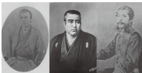
桂小五郎 (木戸孝允)・西郷 隆盛・大久保利通

1864年ごろのことを 知ることができます。 海舟の 活動を 紹介します。海舟は 江戸幕府*や いろいろな 藩**の 人と 会っていました。